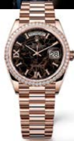
OYSTER PERPETUAL DAY-DATE 36