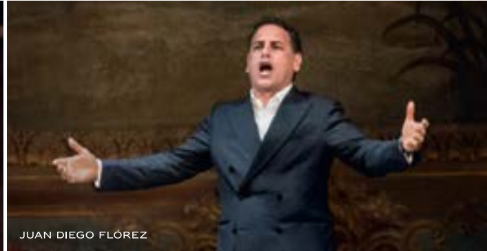
JUAN DIEGO FLÓREZ