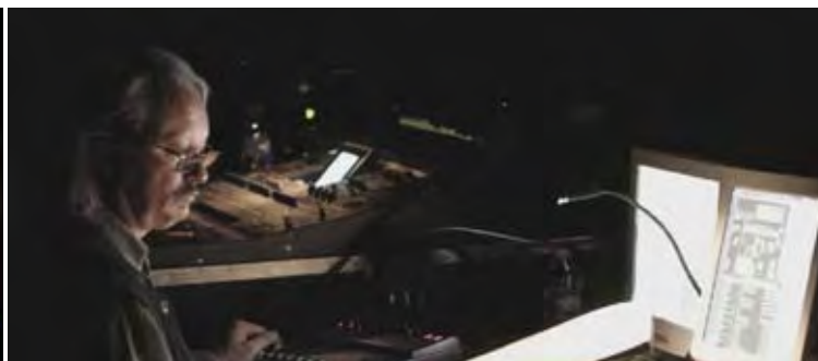
C. Desjardins, P. Manoury